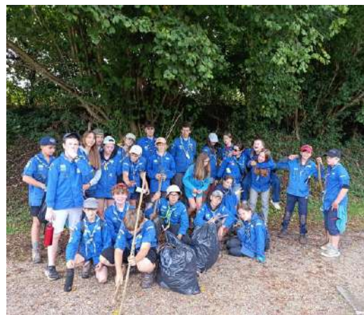
Nettoyage des chemins de randonnée

L'année 2026 commencera par notre Assemblée Générale le samedi 31 janvier dans la salle du Pont neuf. C'est une manière de revenir sur les temps forts de l'année passée et surtout de présenter une année 2026 qui sera très riche en événements.