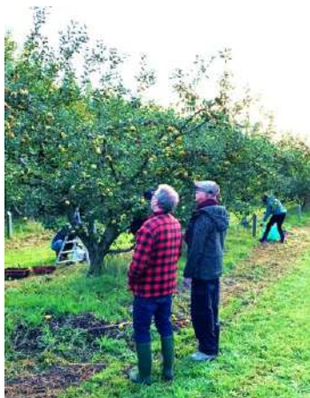
Asnières sur Pomes

Chantier participatif le vendredi 25 juillet pour le nettoyage des chemins de randonnée . 25 scouts des Côtes d'Armor, en camp dans le parc du château de Moulinvieux sollicitent l'association pour une découverte du village et participer à une activité. Enlèvement des bâches de plantation en plastique au pied des arbres des haies du chemin du cimetière.