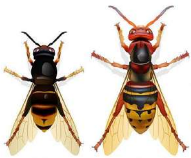
Frelon asiatique Frelon européen

Par contre la commune ne prendra pas en charge les factures pour lesquelles un accord préalable n'aurait pas été signé avec la mairie avant intervention.