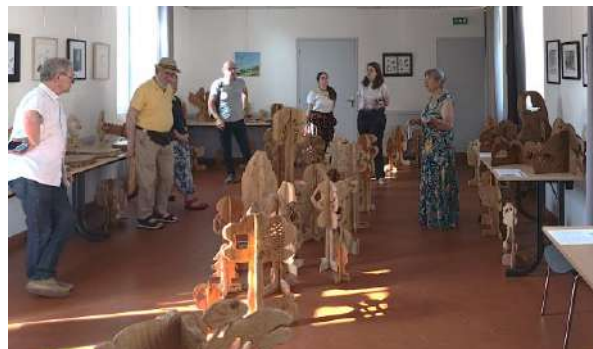
Asnières des bois dans le cadre de la nuit des forêts

Gros plan sur les chantiers participatifs pour agir ensemble à l'entretien de nos patrimoines. Agir concrètement à la conservation du patrimoine et du paysage, faire ensemble et apprendre des pratiques sont les principales motivations des volontaires.